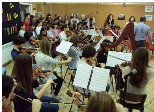
"ens van visitar quaranta persones, entre músics de l'Orquestra i cantants de la Coral"