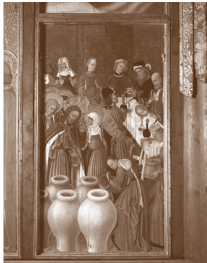
Les noces de Canà Retaule de la Catedral de Barcelona